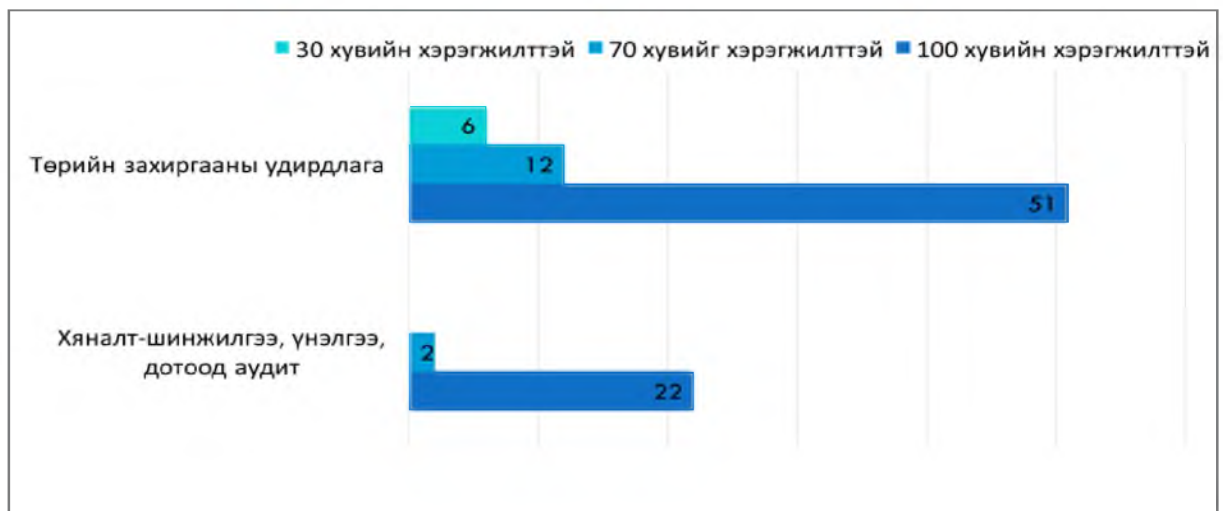
Зураг 2. Гуравдугаар хэсэг. Хуулиар олгосон нийтлэг чиг үүргийг хэрэгжүүлэх зорилт, арга хэмжээний хэрэгжилт

Мэдээллийн эх сурвалж: Барилга, хот байгуулалтын яамны Төсвийн Шууд захирагчийн 2019 оны гүйцэтгэлийн тайлан