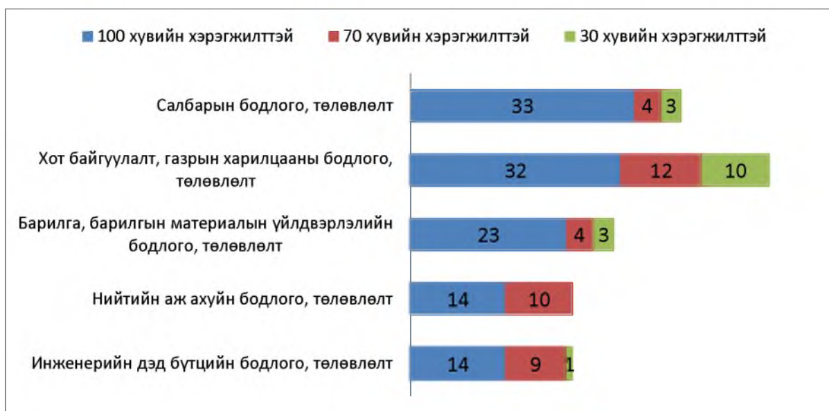
Зураг 2. Нэгдүгээр хэсэг. Бодлогын баримт бичигт тусгагдсан зорилт арга хэмжээний хэрэгжилт

Мэдээллийн эх сурвалж: Барилга, хот байгуулалтын яамны Төсвийн Шууд захирагчийн 2019 оны гүйцэтгэлийн тайлан