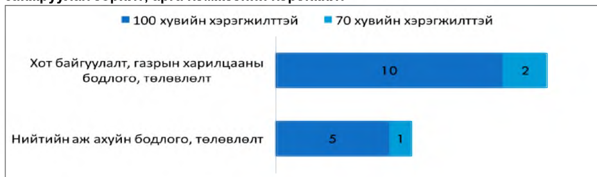
Зураг 2. Хоёрдугаар хэсэг. Төрийн үйлчилгээний чанар хүртээмжийг сайжруулах зорилт, арга хэмжээний хэрэгжилт