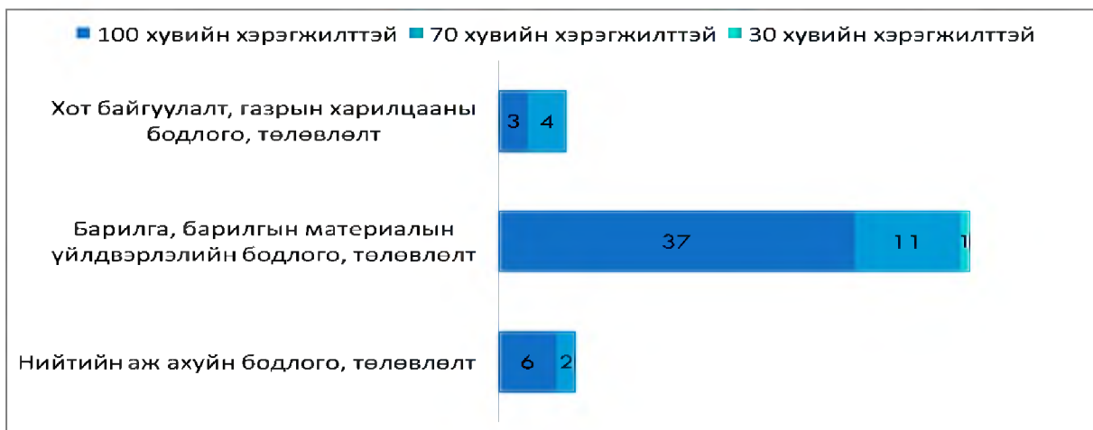
Зураг 1. Гуравдугаар хэсэг. Хуулиар олгогдсон чиг үүргийг хэрэгжүүлэх зорилт, арга хэмжээний хэрэгжилт